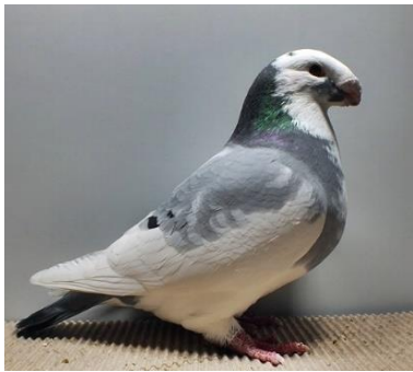
0,1 alt, gescheckt Nils Schmitt V97 ST (Nr. 465)