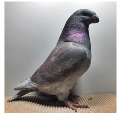
1,0 indigodunkel Oliver Gärtner V97 ST (Nr. 318)