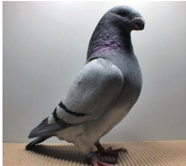
1,0 jung, blau m.schw. Binden Mario Eberhardt V97 RB (Nr. 43)