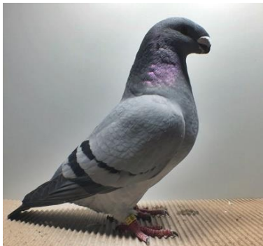
0,1 alt, blau m.schw.Binden Steffen Apel V97 KVP (Nr. 115)