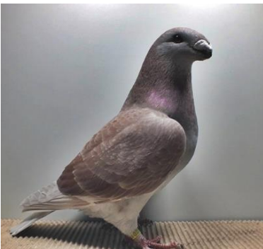
0,1 alt, rotfahldunkelgehämmert ZG Montag V97 Pok (Nr. 377)