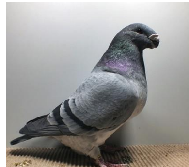
1,0 alt, blauschimmel Andrea Lindenmayer V97 SRB (Nr. 483)