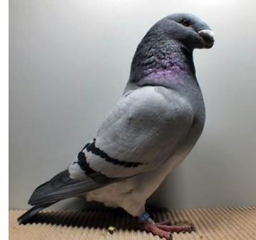
1,0 jung, blau m.schw. Binden Siegfried Rupp V97 SRB (Nr. 64)