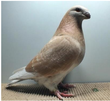
0,1 alt, gelbfahldunkelgehämmert ZG Montag V97 E (Nr. 401)