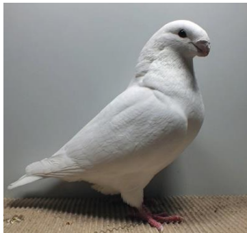
1,0 jung weiß Jim Götz V97 ST (Nr. 468)