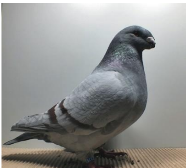
0,1 jung, indigo m. Binden Franz Langenegger V97 SRB (Nr. 166)