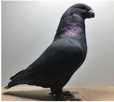
1,0 jung, schwarz Edgar Heim V97 SRB (Nr. 3)