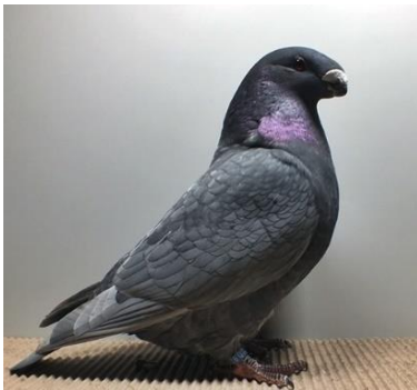
0,1 jung, andalusierfarbig Oliver Gärtner V97 LVP (Nr. 142)