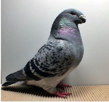
0,1 alt, blauegehämmert Nils Schmitt V97 SRB (Nr. 245)