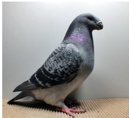
0,1 alt, blauegehämmert Thomas Schuler V97 ST (Nr. 295)