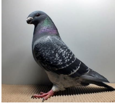
1,0 jung, blauegehämmert Oliver Gärtner V97 SRB (Nr. 257)