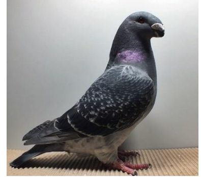
0,1 jung, blauegehämmert Oliver Gärtner V97 E (Nr. 275)