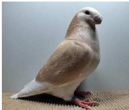
1,0 jung, gelbfahldunkelgehämmert ZG Montag V97 SRB (Nr. 382)