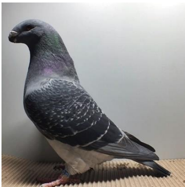
0,1 jung, blauegehämmert Thomas Schuler V97 SRB (Nr. 278)