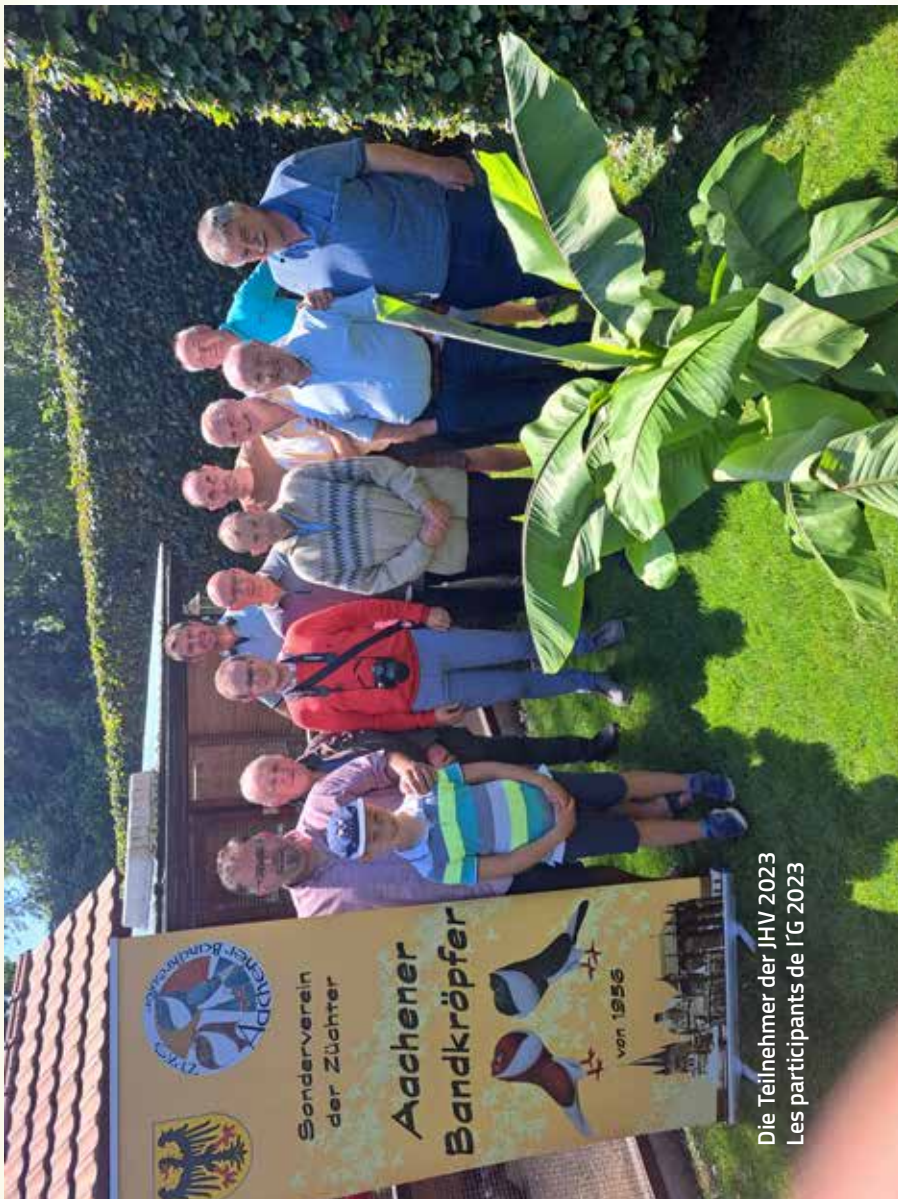
Die Teilnehmer der JHV 2023 Les participants de l'G 2023