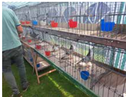
Jungtiere der Aachener Des jeuns sujets de Boulant des Aix-la-CShapelle