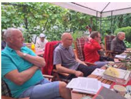
Teilnehmer der JHV Des participants de l'AG