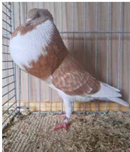
1,0 gelbfahlgehämmert, HSS 2023, hv SVE, Klaus Ruppert

stein a montré ce qui est actuellement réalisable : 1 mâle et 3 femelles avec une taille, une silhouette, une tête avec une huppe, un œil et une couleur excellents, ainsi qu'un jabot impressionnant. Les souhaits con-