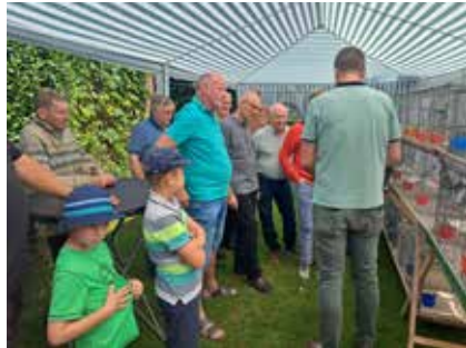
Jungtierbesprechung Discussion des jeuns sujets