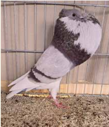
1,0 rotfahl, HSS 2023, V LVP, Klaus Ruppert

Dem folgten dann 6,4 Vertreter des roten Farbenschlages, Vorzüge waren Stand, Haltung, Kopfpunkte und Zeichnung. Auch das Blaswerk wurde gelobt. Als Wünsche wurden im Rücken und Schwanz geschlossener, Halsfeder glatter sowie auf Pupillensitz achten notiert. (V an Klaus