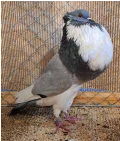
0,1 blau ohne Binden, HSS 2023, V LVM, Lutz Mühlstädt

an Lutz Mühlstädt). Bei den 4,4 hohigen in blau, stellte Zfr. Mühlstädt 2 sensationelle Tiere, hier verdient 2x V. Sie wußten im Typ, Blaswerk und Kopfpunkten zu gefallen, auch die Zeichnung und die aufgerichtete Haltung sowie die Augenfarbe wurde positiv hervorgehoben. Als wünsche kamen, Rücken abgedeckter farblich im Kopf reiner sowie Schwingen glatter auf die Karte. Die rotfahlen auch in einer starken Kollektion von 7,5 dort zeigte Klaus